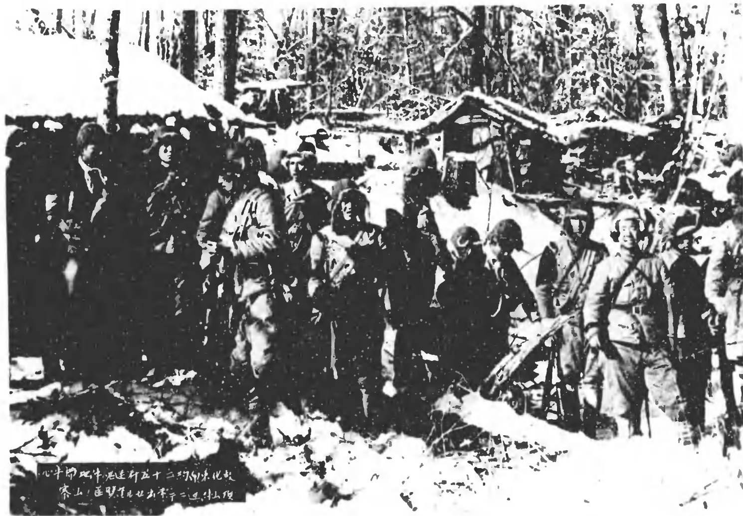
此山は、北緯五十二度の地、 冬季、雪が降り、登山は困難である。