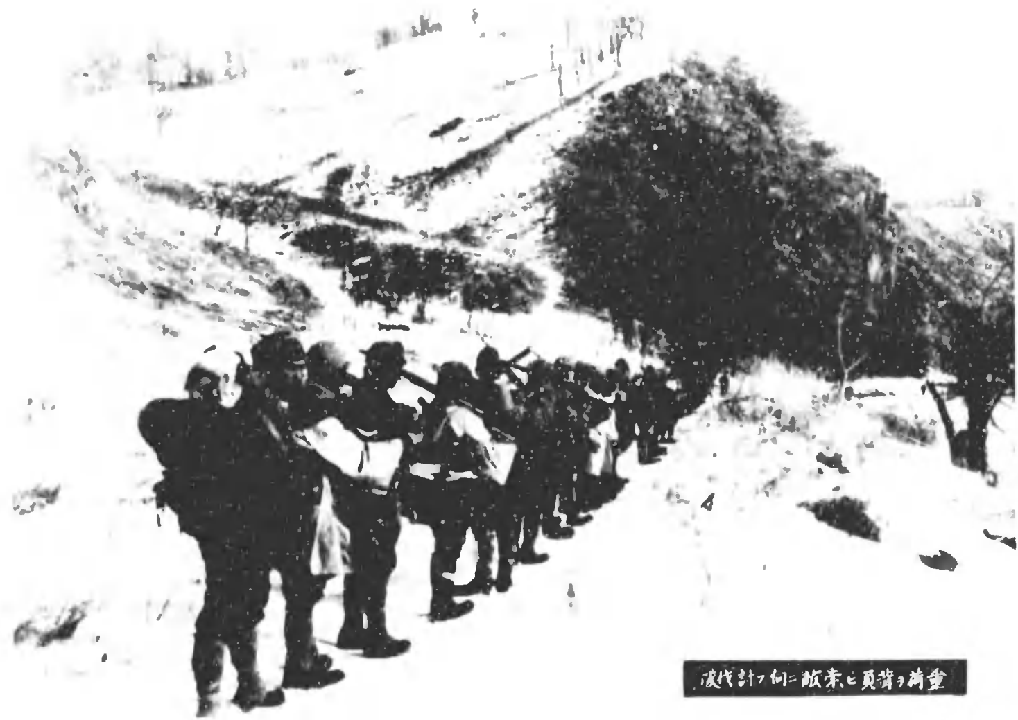
荷重の背負と杖の杖