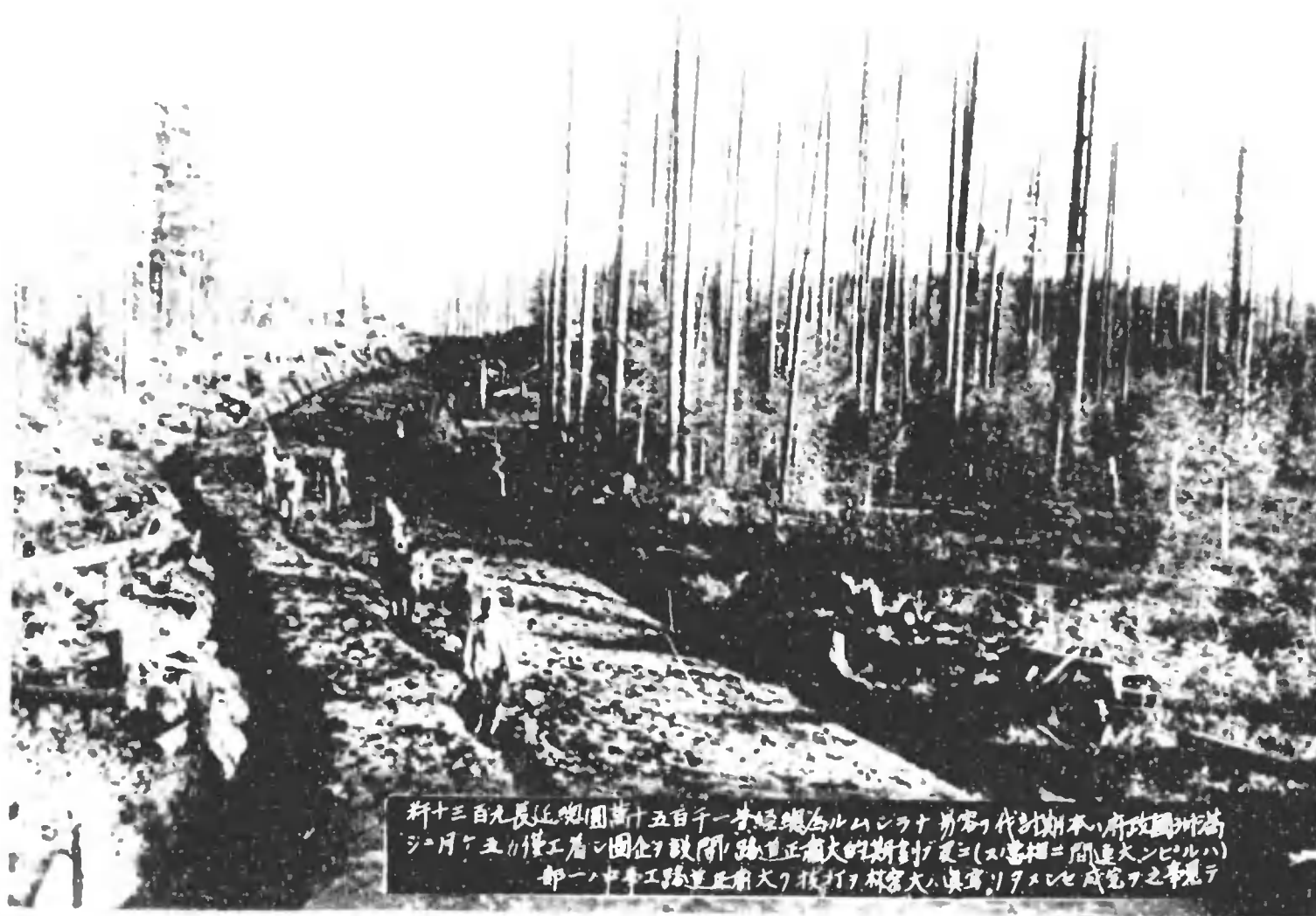
新十三百九長延(園)萬十五百千一(米)經總(ル)ムシラナ(チ)第(チ)代(チ)期(本)府(政)國(州)高 シ(月)々(五)リ(僅)工(者)ニ(固)企(ヲ)設(開)路(道)正(直)大(的)期(計)ヲ(更)ニ(ス)密(相)ニ(開)進(大)ン(ビ)ル(ハ) 部(一)ノ(中)事(工)路(道)正(直)大(的)期(計)ヲ(更)ニ(ス)密(相)ニ(開)進(大)ン(ビ)ル(ハ)