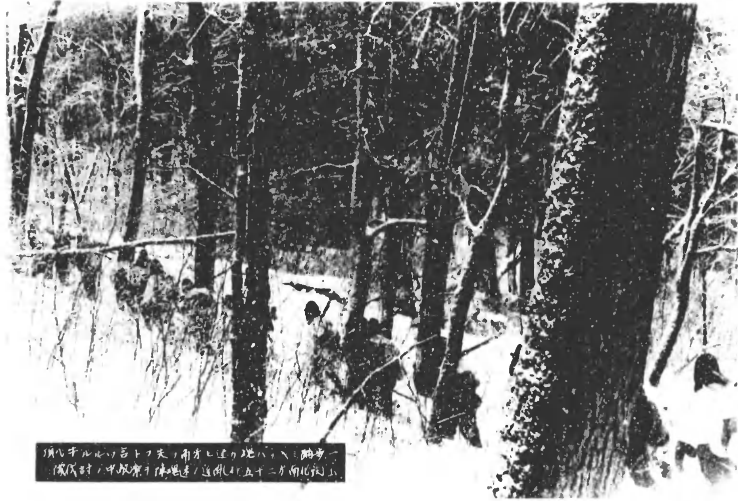
須ヶ子ルルノ古トフ夫、南才ヒ連リ地ハ、ハ、踏歩一 儀成時、中取兼チ陣地邊ノ道側(町五十二ノ南北ノ)