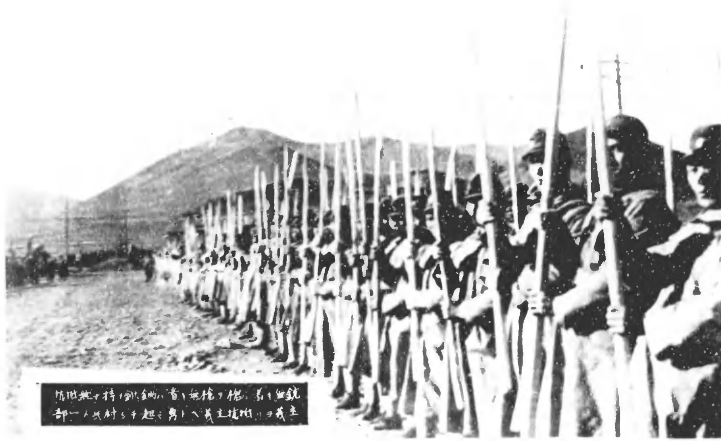
防衛隊持刀全備者、無槍者、着、銃 部、人員、村、子、起、男、ノ、義、主、持、槍、ヲ、義、主