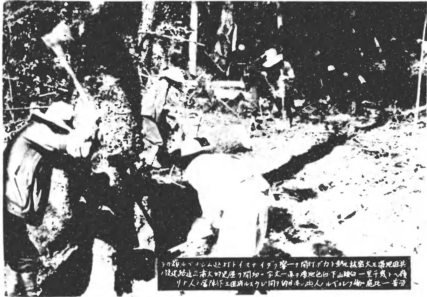
ラカシルベヨシムとトイマナイダラ一ノ開ドカト地杖密大ニ帯地匪共 陸運防道正南大の建屋ノ開切ニ字文一帯ヲ帶地色白下山峻白一里千幾トへ積 リト人ノ管陣作工匠將ルスレ同ノ的日亦此人ルベヨレノ物ニ處比一苦勞