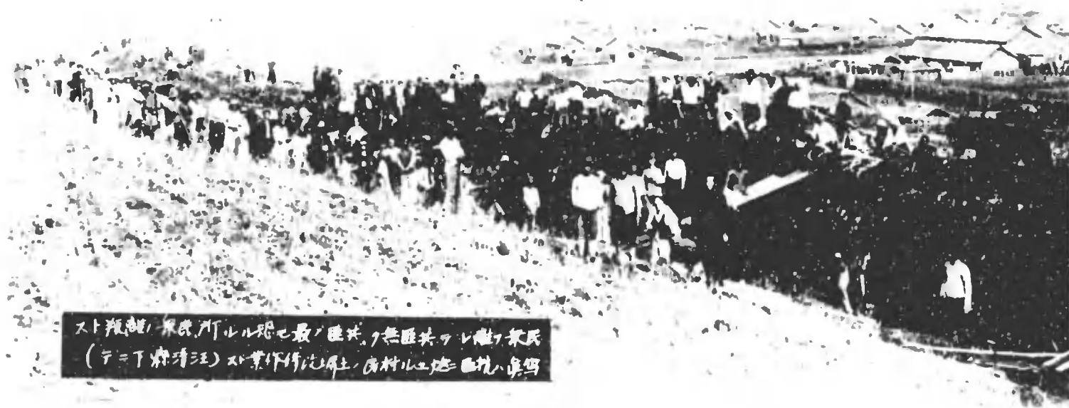
スト報部(東京)アルル路七最ノ匪共ヲ悉ク其ヲレ捕テ其氏 (テ=下野清江)ノ業作作記原上、民村ルニ地ニ於テハ真写