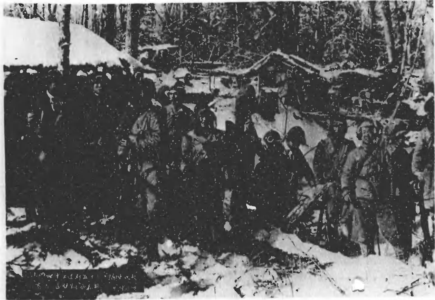
1. 1941年12月25日 16時頃 2. 1942年1月1日 16時頃