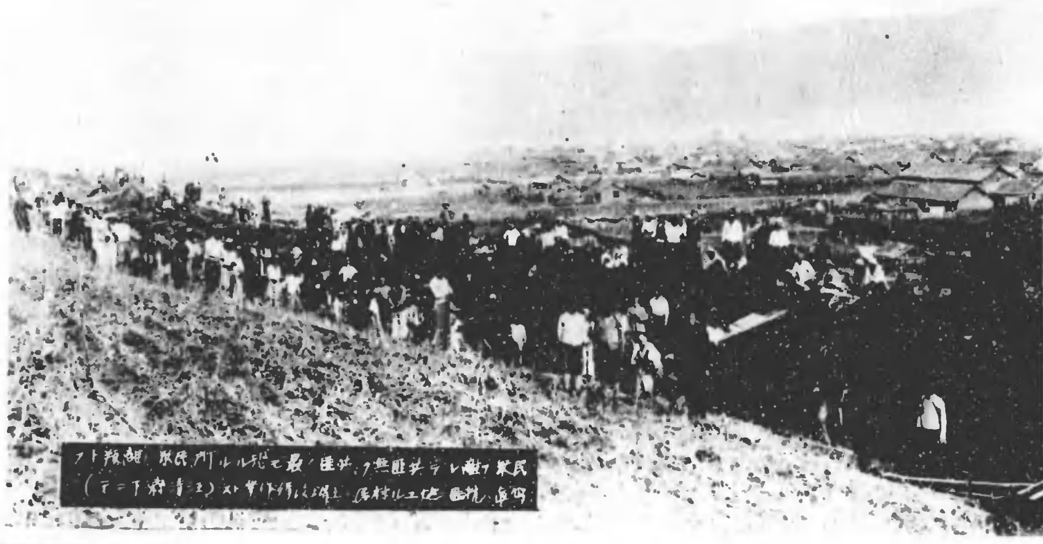
アト類胡 取民門ル地七最 陸共ノ無匪共レ敵ノ兼氏 (ア=下流青工) 土中作修以湖上 居村ル工也 西境 庫四