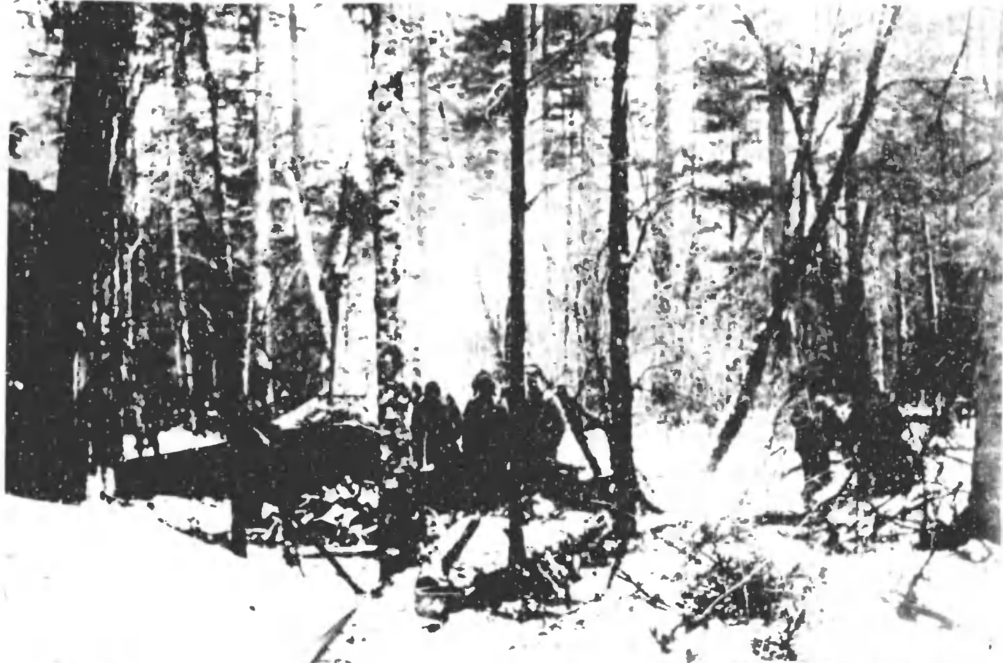
菅 菟 内 林 窟