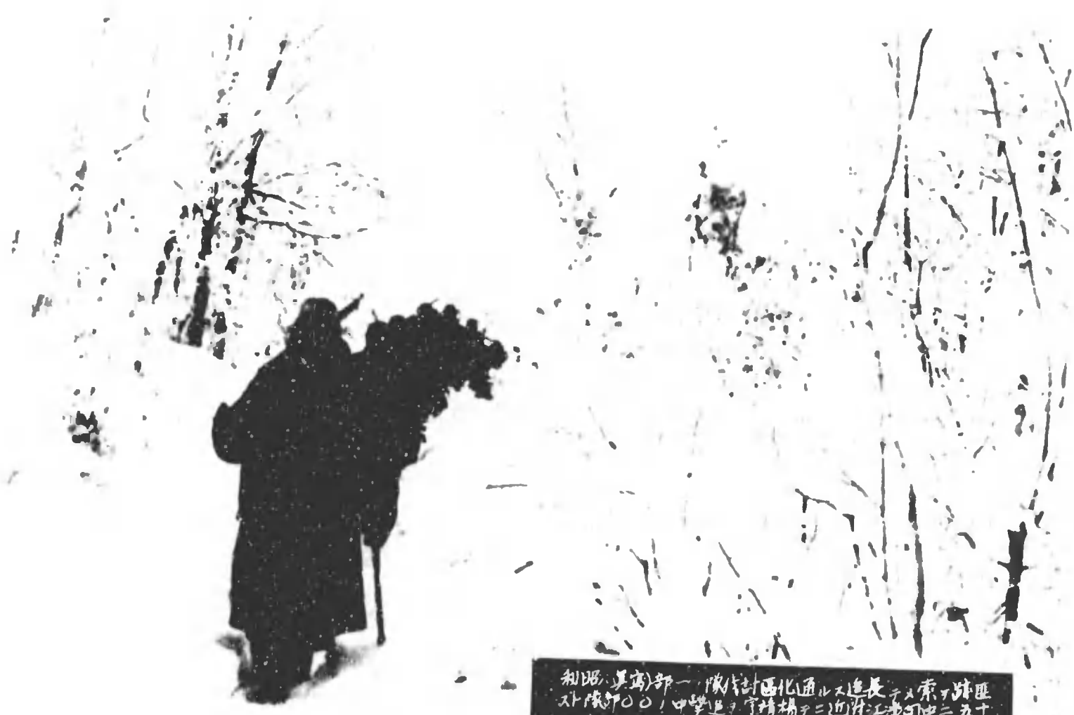
利根、真高部一、隊付區化通ルニ道長ヲ兼テ、兼テ、跡匪 ト隊師〇〇、中學上ヲ、宇精楊ヲニ、近所江、渡町中ニ、五十