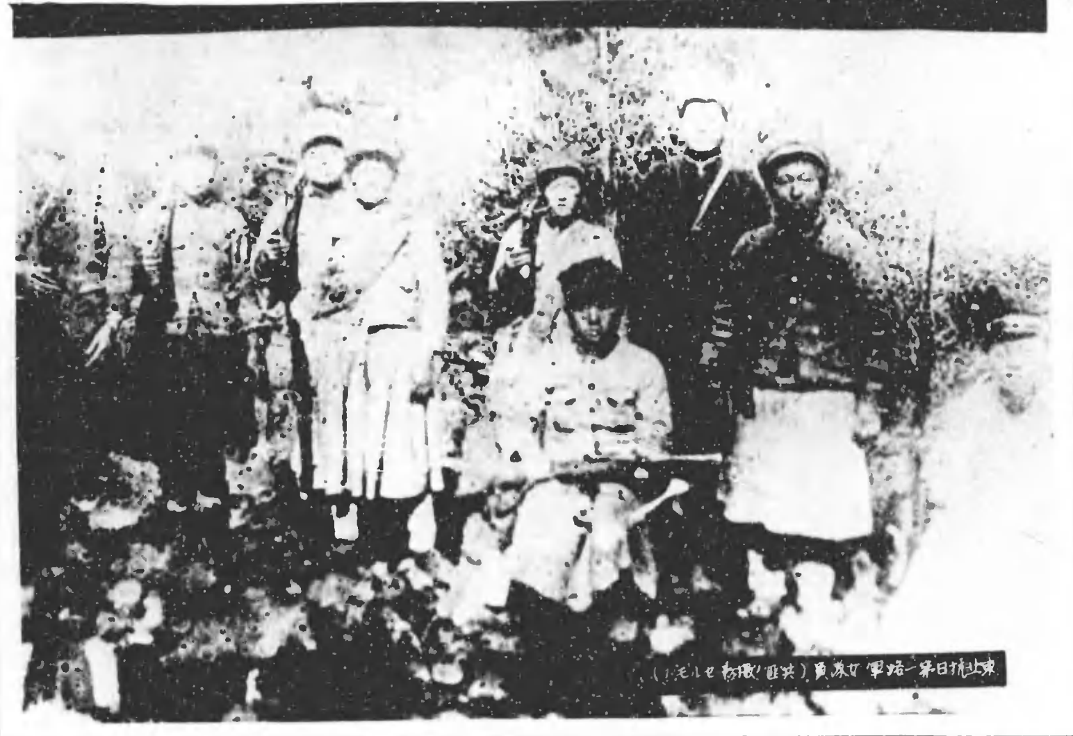
(元) 七 七 七 (七 七) 員 隊 中 路 一 第 日 止 東