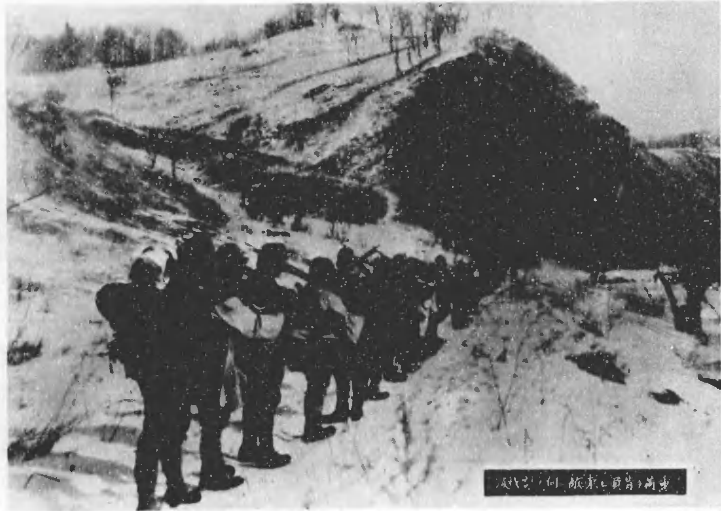
越前、何、飯、東、山、背、の、新、道