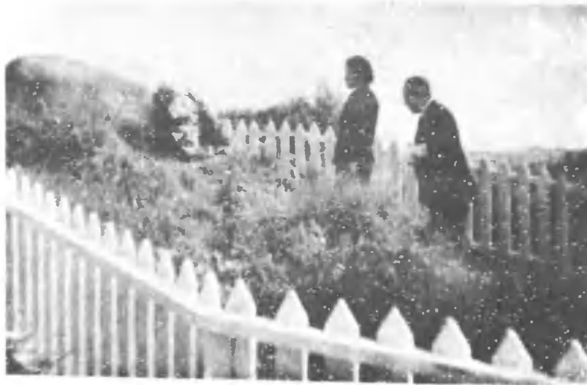
バグナー中将戦死の跡