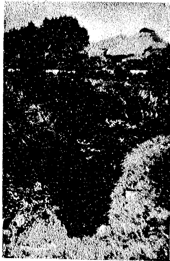
雨宮中将戦死の壕