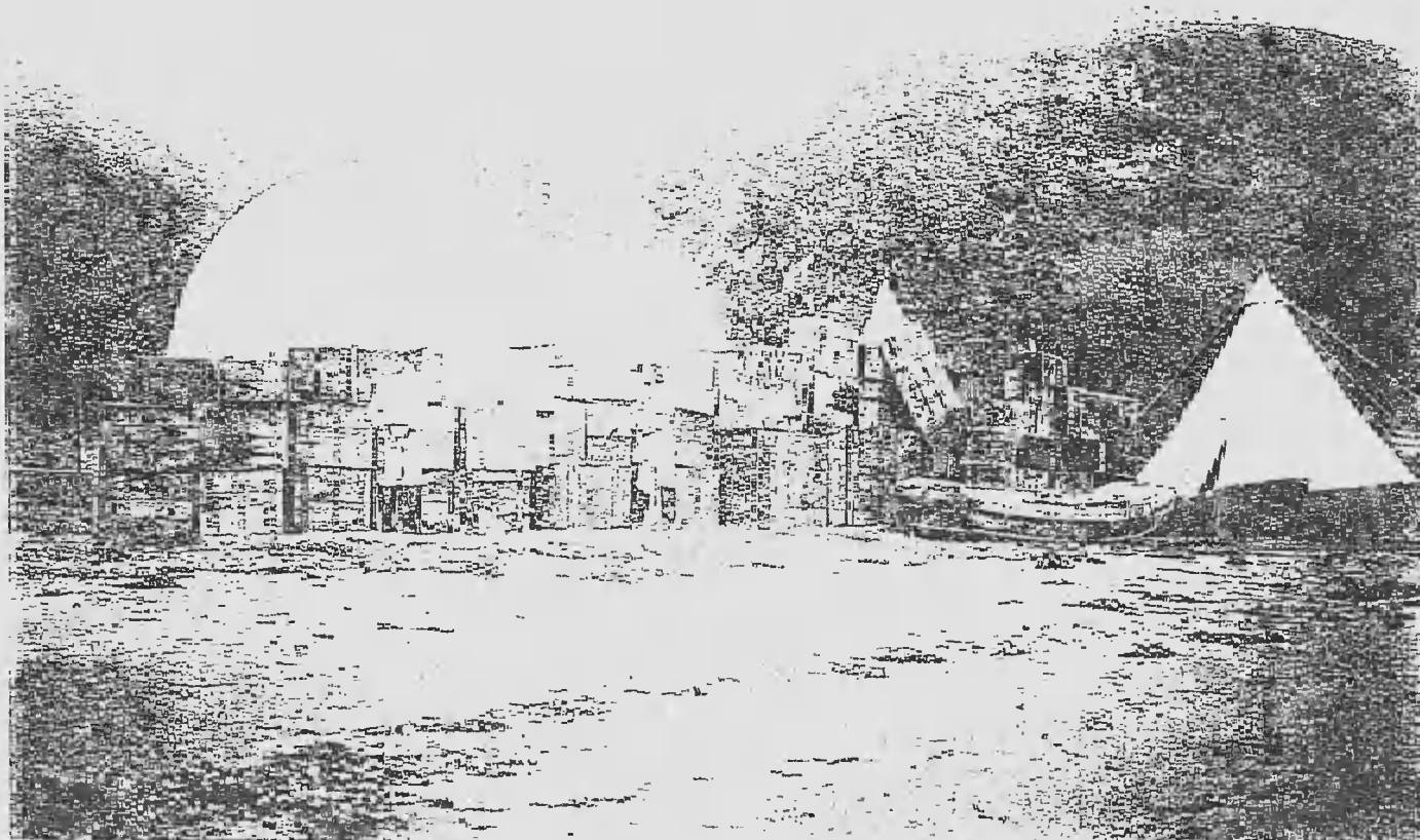
(景ノ護保球氣シ對ニ風強ケ上ミ積ヲ類箱空)