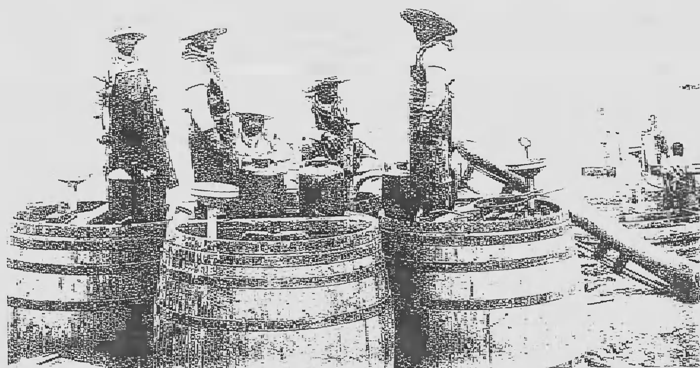
(圖ノ置裝生發斯瓦素水)