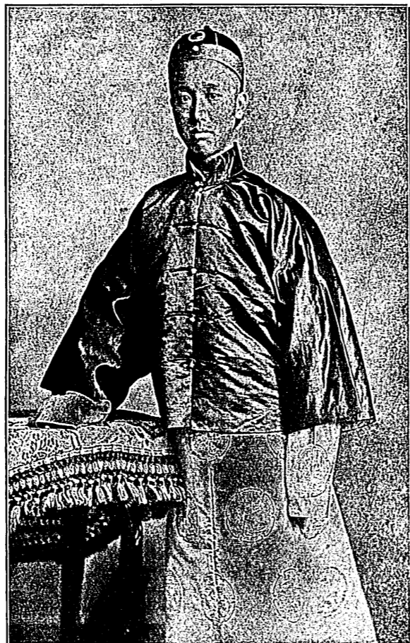
大 清 攝 政 王 醇 邸 肖 像