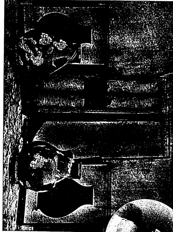
英貴婦戈登氏及其御賜之寶物