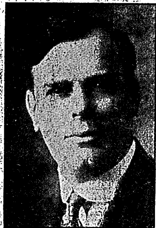
JUDGE JAMES L. COKE

The Hon. James L. Coke, chief justice of the supreme court of Hawaii, has been invited by the Imperial Japanese government to go to Japan to give there a series